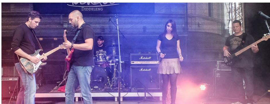
Fête de la Musique Dudelange 2016