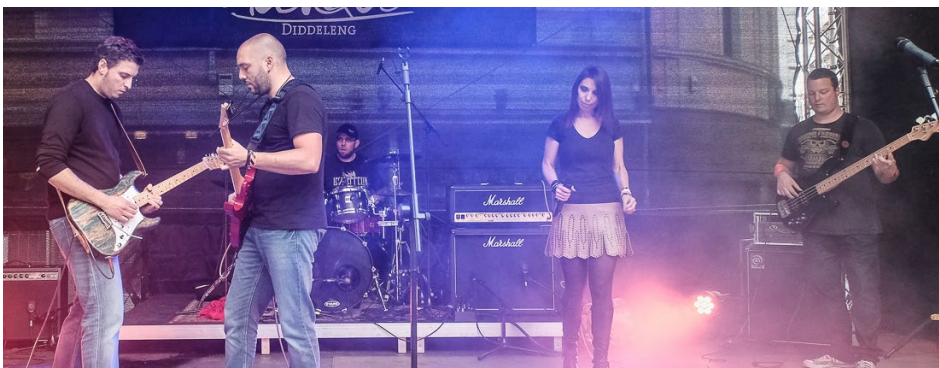
Fête de la Musique Dudelange 2016