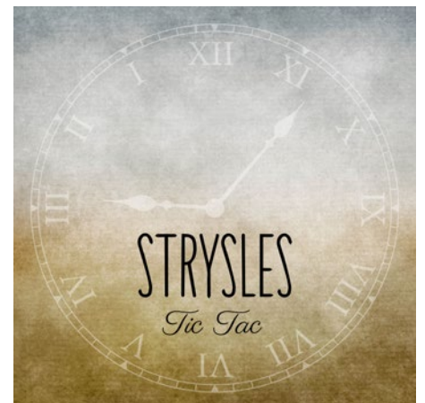
Le premier EP est sorti en avril 2016

Les Strygles ont senti le besoin de se renouveler au début de 2015. Et si on ajoutait